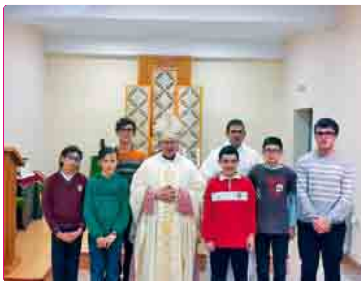
El Sr. Obispo con los seminaristas menores.

En las aulas que el Sr. Obispo visitó, saludó cordialmente al profesor y se dirigió a los alumnos en tono desenfadado y alegre, invitándoles a aprovechar esta etapa académica y a confiar en Jesucristo mediante la oración de cada día y la cercanía a la Iglesia. También bromeó con algunos de ellos, haciendo honor a su fama de persona cercana y afable.