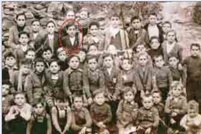
D. Felipe cuando era niño.