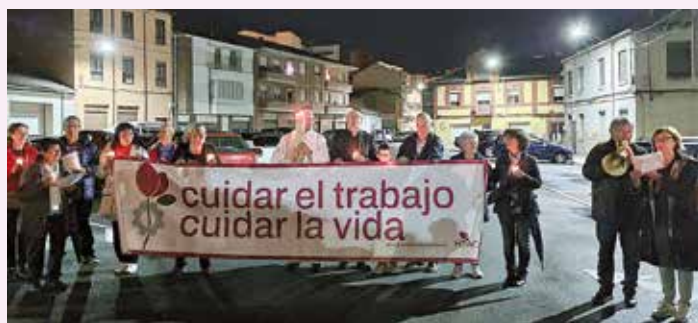
Lectura del manifiesto