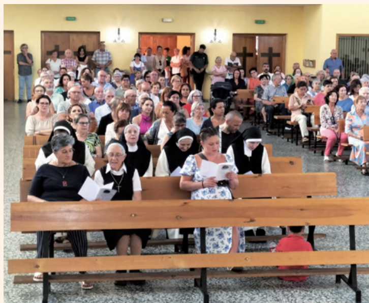
Un momento de la Eucaristía

Los asistentes compartieron al finalizar la Santa Misa, un ágape fraterno en el recinto ferial.