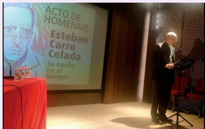
El obispo de Astorga en el acto de homenaje