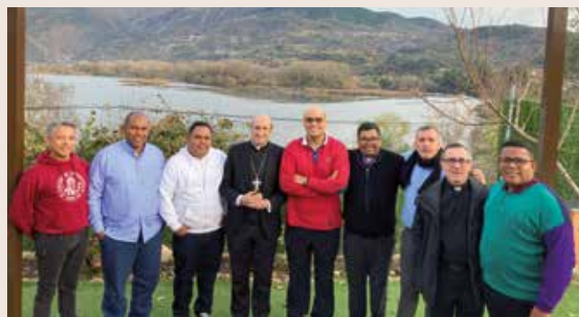
Sacerdotes venezolanos con el obispo y el vicario general

No faltó en la mesa la alegre música ni ningún alimento propio de la celebración navideña en Venezuela: patrones de la región occidental, cachitos y tequeños de la región oriental. Hallacas, ensalada de gallina, lomo de cerdo y pan de jamón. Postre de peras al vino y golfiao de la región central.