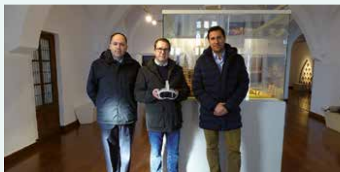
Un momento de la presentación