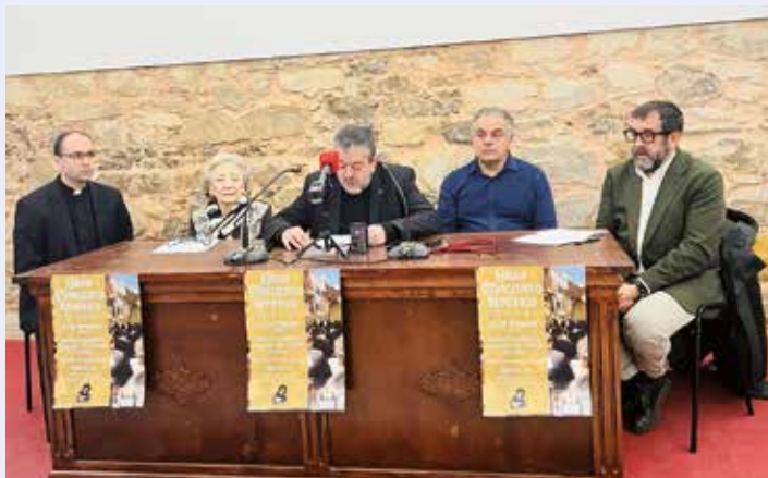
Un momento de la presentación del concierto

La Comisión de la Coronación Canónica de Nuestra Señora de los Dolores de la parroquia de San Bartolomé de Astorga organiza un concierto benéfico a cargo de la Sociedad Filarmónica Nuestra Señora del Carmen (Salteras) a favor de la Obra Social de la Coronación.