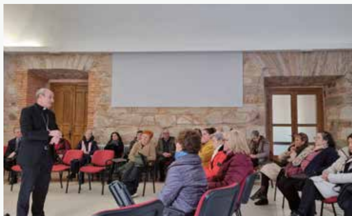
Retiro en Astorga

Después hubo un tiempo, en cada lugar, de oración ante el Santísimo, seguido de informaciones, de diálogo entre los presentes y café compartido en alguno de los lugares.