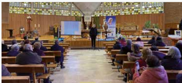
Un momento del retiro en Galicia

El prelado centró su meditación en torno al texto del evangelista San Mateo de la parábola del trigo y la cizaña. El título de su exposición fue “Sembró buena semilla en su campo”.