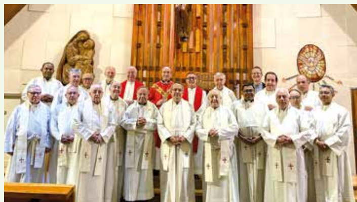
Sacerdotes participantes con los dos obispos