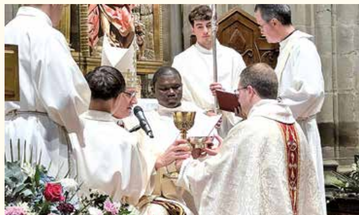
Entrega del cáliz y la patena

El momento central del rito de la ordenación es la imposición de manos, este expresivo gesto realizado por el obispo juntamente con todos los sacerdotes y la posterior oración consagratória confieren el presbiterado. Por tanto,