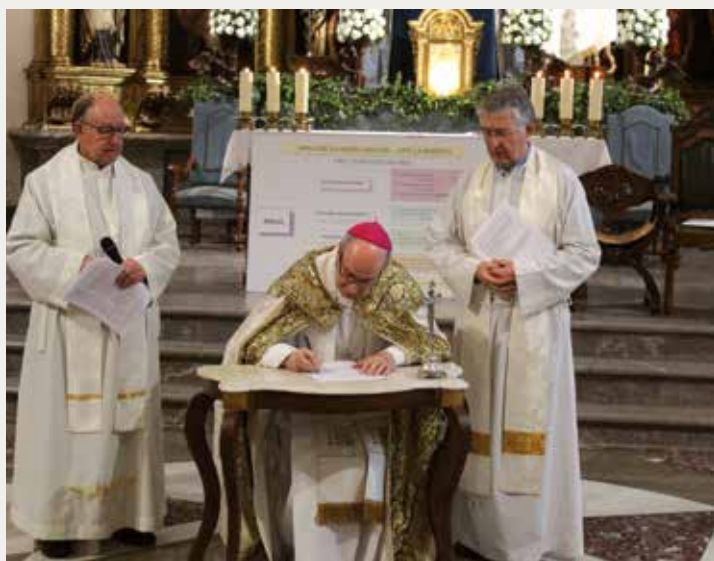
Firma del acta de constitución