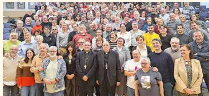
Participantes en las jornadas