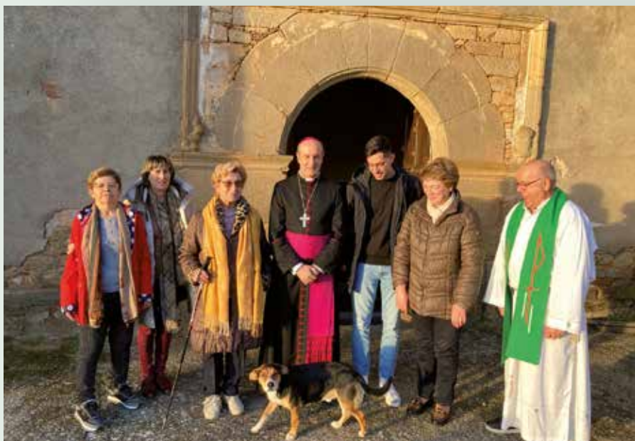
El Sr. Obispo de visita pastoral en Villaviciosa