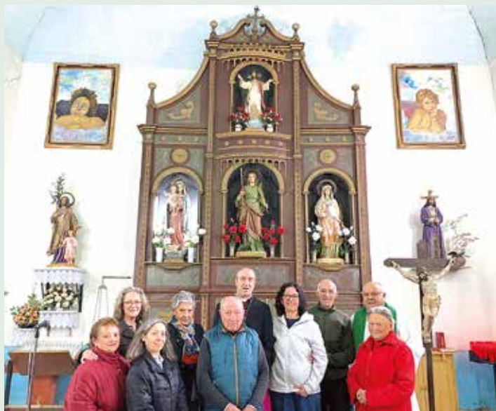
Con los feligreses de Igiñeña

La primera parroquia en ser visitada fue la dedicada a Santa Dorotea de COLINAS DEL CAMPO de Martín Moro Toledano. Tras la bienvenida al Sr. Obispo por parte de los feligreses en el atrio del templo, tuvo lugar la celebración de la Palabra con la distribución de la sagrada comunión. El prelado asturicense dedicó unas palabras de admiración sobre la belleza de las imágenes del templo y, seguidamente, se hicieron una foto de grupo. La despedida fue personalizada regalando a cada uno la estampa conmemorativa de la visita.