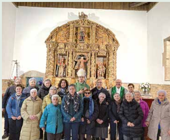
En Quintana de Fuseros

Este día concluyó en la parroquia de La Asunción de QUINTANA DE FUSEROS donde el Sr. Obispo presidió la celebración de la Santa Misa, se hizo una foto de grupo y se despidió de los feligreses, al igual que en las anteriores parroquias, regalando a cada uno la estampa conmemorativa de la visita.