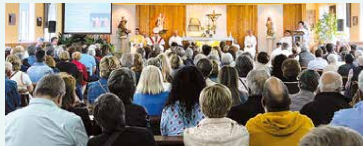
Un momento de la Eucaristía

en la importancia de mantenernos firmes en nuestros valores y principios y alertó de "la adicción a los ídolos que nos separan del amor y el perdón de Dios, y recalcó el compromiso necesario para servir a Dios en lugar de al dinero".