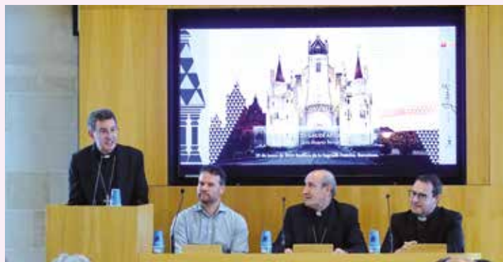
Un momento de la presentación en Barcelona

Desgranó el trabajo condensado en el libro “Palacio Gaudí Astorga” y concluyó su intervención señalando que “el Palacio no es hijo de una época concreta, puesto que su construcción y adorno se ha diferido a lo largo de distintas y sucesivas décadas. Por ello, podemos decir que la nueva Obispalía asturicense ha