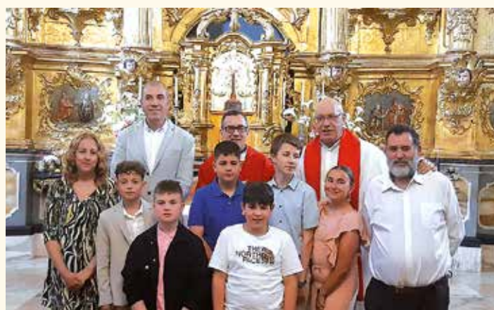
Confirmandos de Benavides con el Vicario General y el párroco