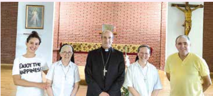
Con las religiosas de la Casa de Acogida