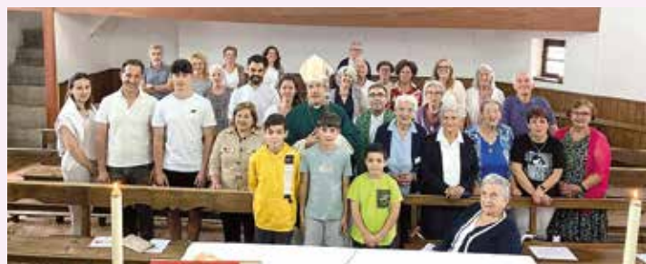
En Santa Cruz

A continuación, se trasladó a la parroquia de San Miguel de MATARROSA DEL SIL donde celebró la santa Misa, tuvo un responso por todos los difuntos, foto de grupo y despedida personal entregando la estampa conmemorativa. También fue invitado a un vino español en dependencias municipales.