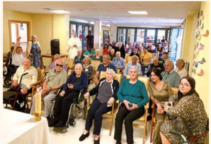
En la residencia San Nicolás