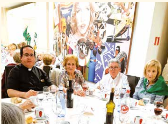
Un momento de la comida de hermandad