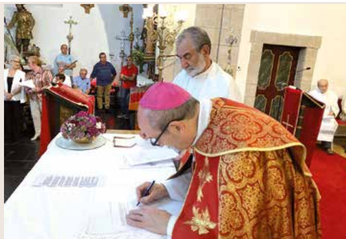
El Sr. Obispo firmando el acta

que la forman, el Consejo Pastoral y los Equipos de los tres sectores: Evangelización, Caridad y Liturgia.