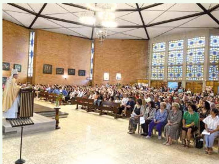
Un momento de la celebración del 60 aniversario