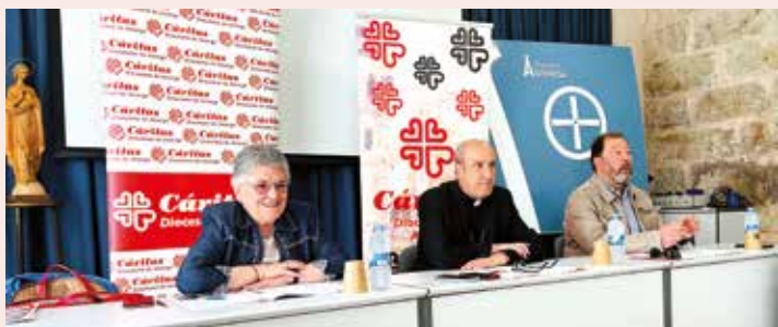
Un momento de la presentación en Astorga

El prelado asturicense ha dado las gracias a los 195 voluntarios, a los 10 técnicos y a las 114 personas que trabajan en esta institución y ha recordado que “Dios quiere hacerse cercano allí donde se le necesita”. También ha reseñado, como obispo responsable de Cáritas en la CEE, que, a nivel nacional, ha aumentado el riesgo de pobreza y ha recalado “la necesidad de concienciar a nuestras comunidades del sostenimiento de esta institución con nuestros propios recursos materiales y personales.”