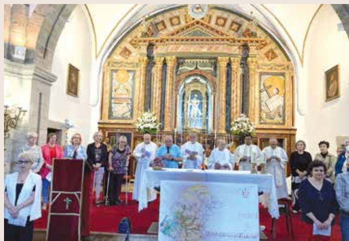
Miembros de esta Unidad Pastoral