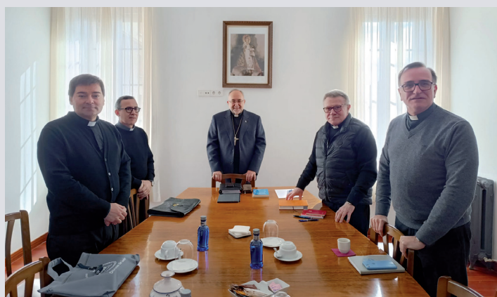
Vicarios con el arzobispo

Se trata de una reunión preparatoria del gran encuentro de la Provincia Eclesiástica que tendrá lugar el próximo mes de noviembre, en León, sobre "El sacerdocio. Ante el desánimo en la vida pastoral y su incidencia en la vida espiritual. Retos y caminos de esperanza."