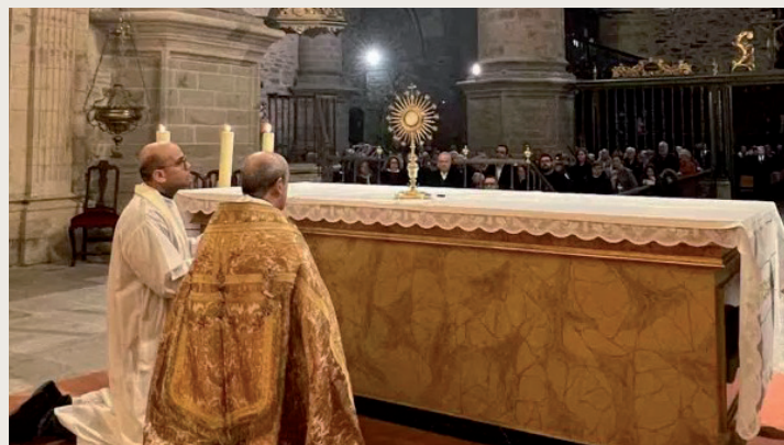
Un momento de la celebración.

Todos compartieron la alegría de volver a la Parroquia de Santa María de Villafranca