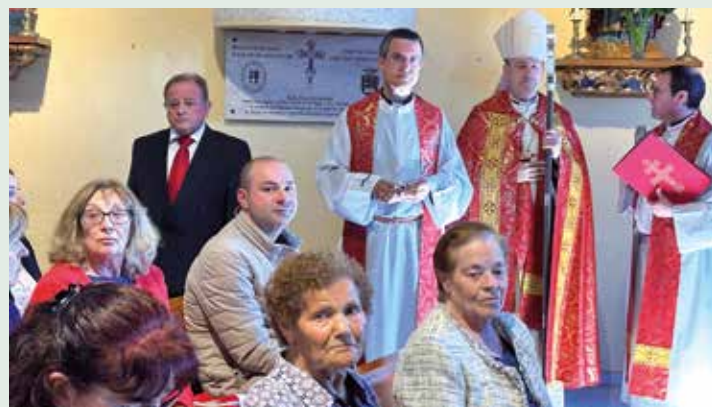
Placa-recuerdo en San Justo

Por la tarde, antes de partir al santuario que la custodia, la Santísima Cruz hizo parada en la parroquia de San Justo de la Vega . Allí, se tuvo una breve oración y, el prelado asturicense descubrió una placa en recuerdo a la visita a esta parroquia tan vinculada con Santo Toribio.