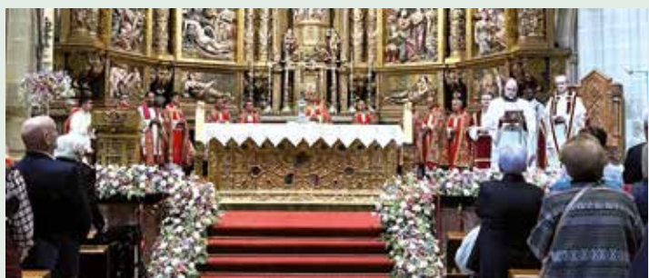
Un momento de la celebración de llegada

El trascoro de la seo asturicense estaba repleto para participar en el profundo y cargado de mensajes Viacrucis Juvenil y Cofrade escenificado con presencia del Lignum