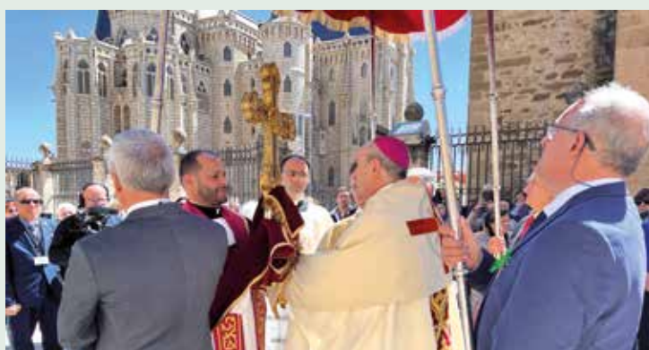
Acto de entrega al arcipreste

de nuevo hacia la S.A.I. Catedral, donde el obispo de Astorga presidía la Eucaristía, en la que hizo referencia a la alegría de nuestra iglesia particular por la presencia de la Santísima Cruz, en el domingo que se celebraba la fiesta de El Buen Pastor y la Jornada Mundial de las Vocaciones y Vocaciones Nativas.