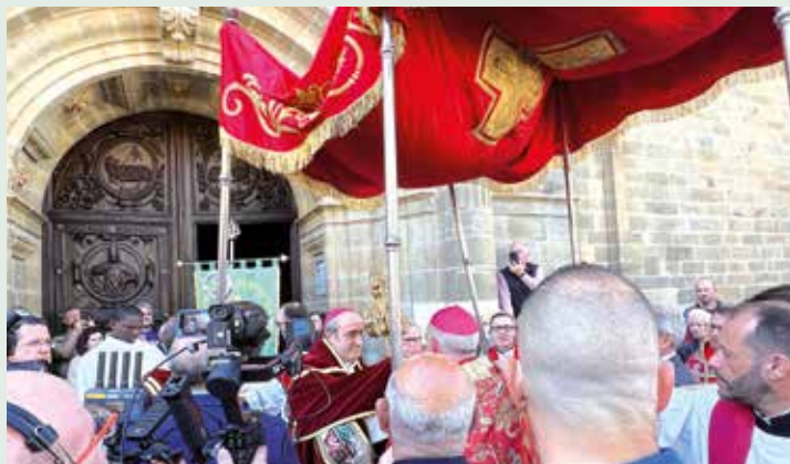
Recepción de la Cruz