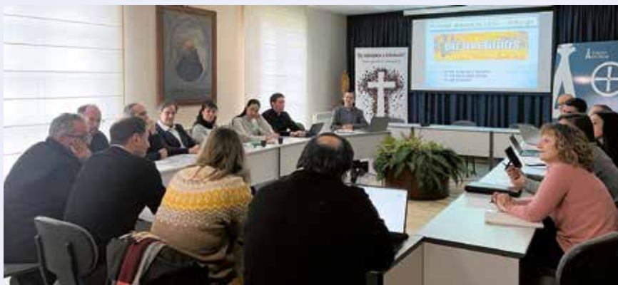
Un momento de la reunión

Finalmente se habló de la importancia de la Coordinación Interdiocesana, de algunas fechas y se puso punto y final con unos minutos de ruegos y preguntas.